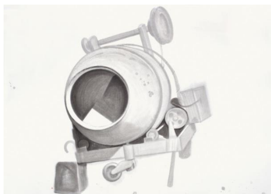
Míchačka, 2014, tuš na papíře, 213 x 300 cm

Provozovatelem Galerie Václava Špály je společnost PPF Art.